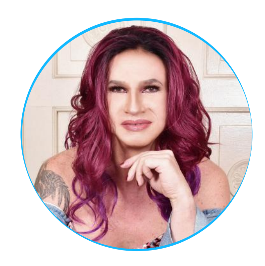
Brigitte Baptiste Rectora Universidad Ean

Concluyeron el Foro: Mujeres más fuertes por Colombia con una reflexión de gran importancia acerca de la reconstrucción del tejido social y la recuperación sostenible del país. "Este ha sido un espacio espectacular que demuestra el poder femenino en todos los ámbitos de la sociedad. Por eso, queremos invitarlos a que nos ayuden a identificar a las próximas Mujeres Cafam, esas mujeres que dan la milla extra para trabajar por sus comunidades, porque ese es un esfuerzo que debe ser reconocido por todos", indicó Baptiste.